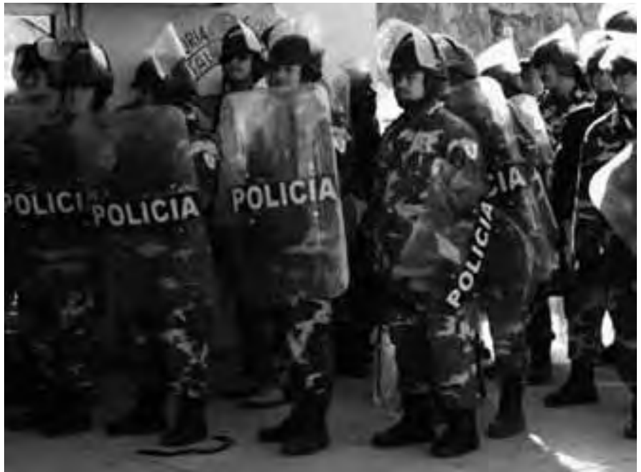
Am 11. Januar 2008, vertrieben Berichten zufolge 700 bewaffnete Bundes- und Landessicherheitsbeamte etwa 1.500 für die Verbesserung von Arbeits- und Gesundheitsschutzstandards streikenden Bergarbeiter in der zur Grupo México gehörenden Mine von Cananea im Bundesstaat Sonora.

Im April 2007 führte das mexikanische Arbeitsministerium (STPS) eine zweitägige Inspektion der Mine von Cananea durch und ordnete 72 Korrekturmaßnahmen an, darunter