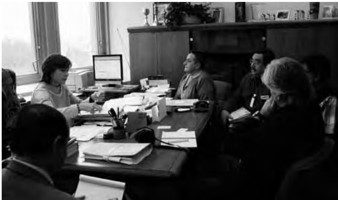
Im November 2006 reichten führende Gewerkschafter der SNTMMSRM bei der Internationalen Arbeitsorganisation Beweise für die Verletzung der Gewerkschaftsautonomie ein, um die am 30. März 2006 eingereichte Beschwerde bei der ILO gegen die mexikanische Regierung zu untermauern.